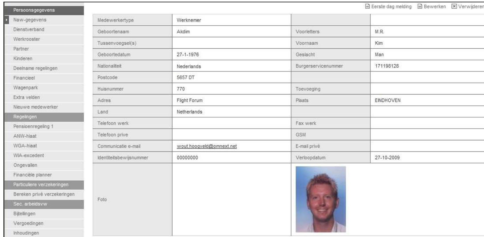
Figuur 3; Gegevens van werknemer