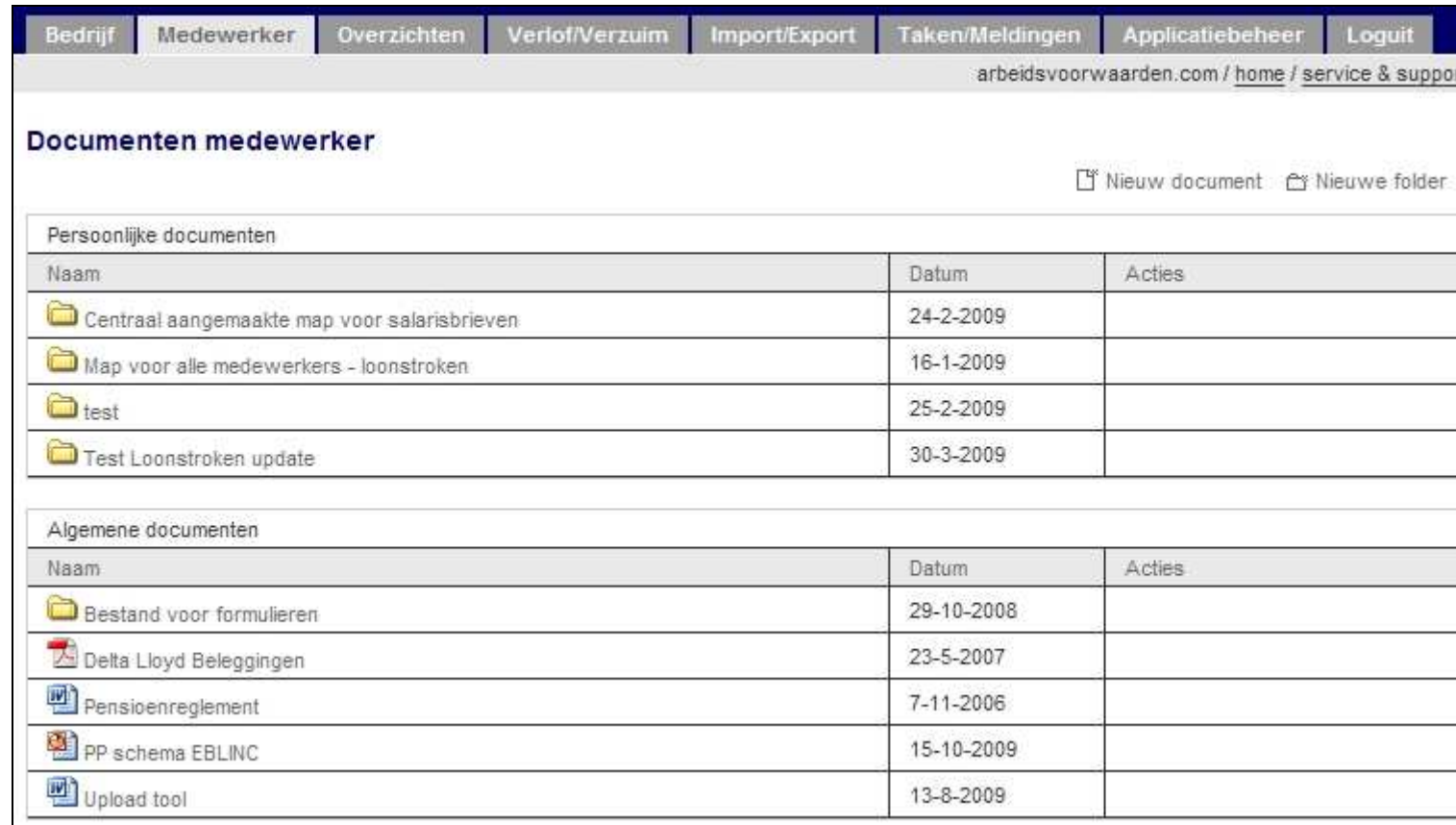
Figuur 2; Overzicht van algemene documenten en specifieke documenten van en werknemer