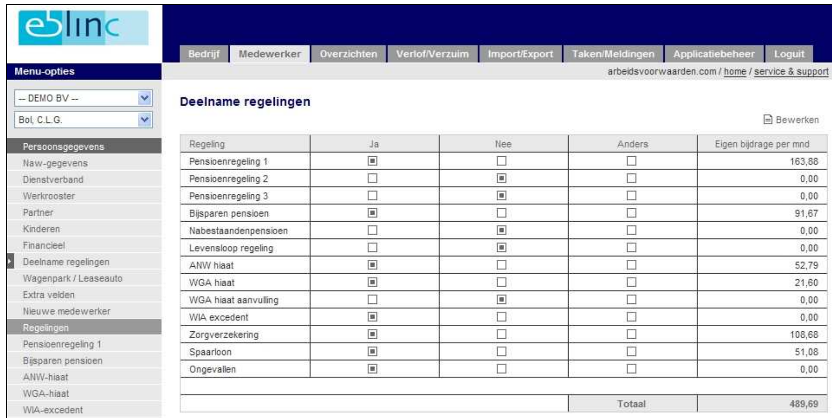
Figuur 6; Direct inzicht in de kosten (inhoudingen) voor de verloning